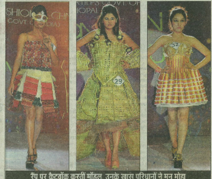
रैंप पर फैटवाक करती मॉडल, उनके खास परिधानों ने मन मोहा