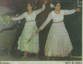
समन्वय भवन में परिधान का रंग बिरंग करती मॉडल।